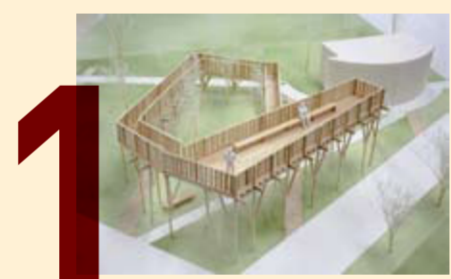
3Dデジタルプラン （仮設テラス模型）