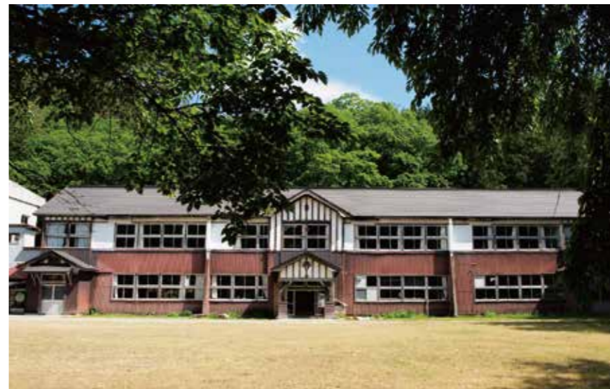
活動拠点「西会津国際芸術村」 住所：福島県耶麻郡西会津町新郷大字笹川上ノ原道上5752 TEL:0241-47-3200

での一つ一つの行為を見直すきっかけとしてアートの視点が入っていかねばならないと考えています。例えば私たちが活動拠点にしている西会津国際芸術村も同じです。子どもの頃にこの場所がなかった人にとっては、その存在が違和感として捉えられてしまうかもしれませんが、子どもの頃から芸術村が当たり前にある世代にとっては、アートの視点で日常を見ることがより近いところに感じられるようになると思います。だから、私はそのくらいの時間軸で森のはこ舟を捉えるようにしています。木が育つのも、川の流れが変わるのも、子どもたちが育って地域が変わっていくのも、1年や2年ではどうにもなりません。そうやって、じつくりと、少しずつ、森のことや自然のことについての価値観が変化したり、付き合いかたが変わって行くことで、新しい時代は切り開かれるのではないかと考えています。その意味では、私たちは、そのきっかけを作り続けているのにすぎないのかもしれない。」