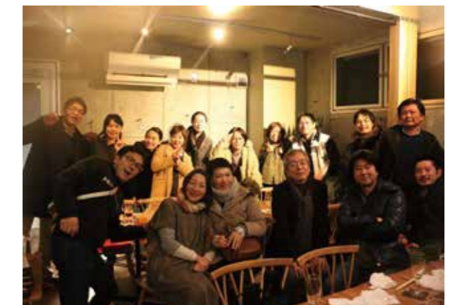
コア会議後の忘年会にて実行委員会のメンバーとともに。(2016年12月)

あるとき、コア会議に出席していて、そう感じたことがあった。文化が生きる時間は、人が生きる時間よりも圧倒的に長い。それは自然がもつ時間の感覚に近いのかもしれない。『森のはこ舟アートプロジェクト』は終わる。だが、3年をかけて同じテーブルで、ともに文化を耕してきた人々が、この土地で生き続けるかぎり、その“もぞもぞ”とした蠢きは続くことだろう。