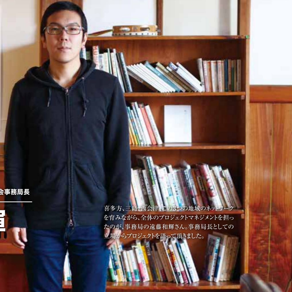
森のはこ舟アートプロジェクト 実行委員会事務局長