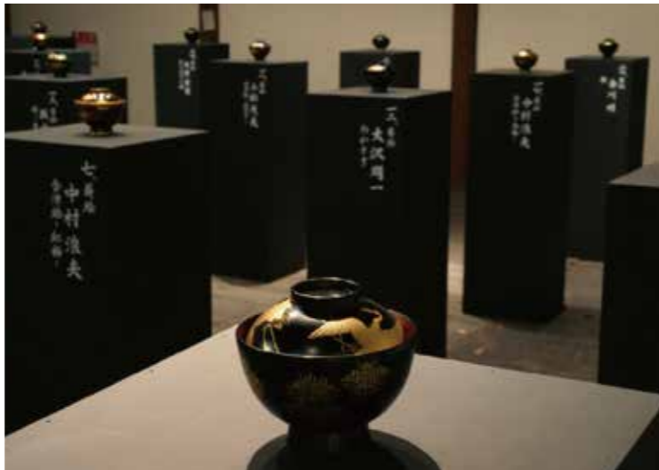
『会津・漆の芸術祭2012』くいぞめ椀プロジェクト

川延「そこで大事なのは、これまでの既存の価値基準で成果を判断してはいけないということですね。新しい関係性を作っていくわけですから、そこには『動員数』などの数の論理を持ち込むわけにはいかない。むしろ、新しい価値判断の軸を作るところから始めなければならないかもしれません」