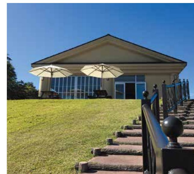
活動拠点「諸橋近代美術館」 *写真は「諸橋近代美術館アートテラス」 福島県耶麻郡北塩原村大字松原字剣ヶ峯1093 TEL:0241-37-1088

*2016年度北塩原村エリアプログラムは、上記の2館と、北塩原村地域おこし協力隊、事務局が協働して実施しました。