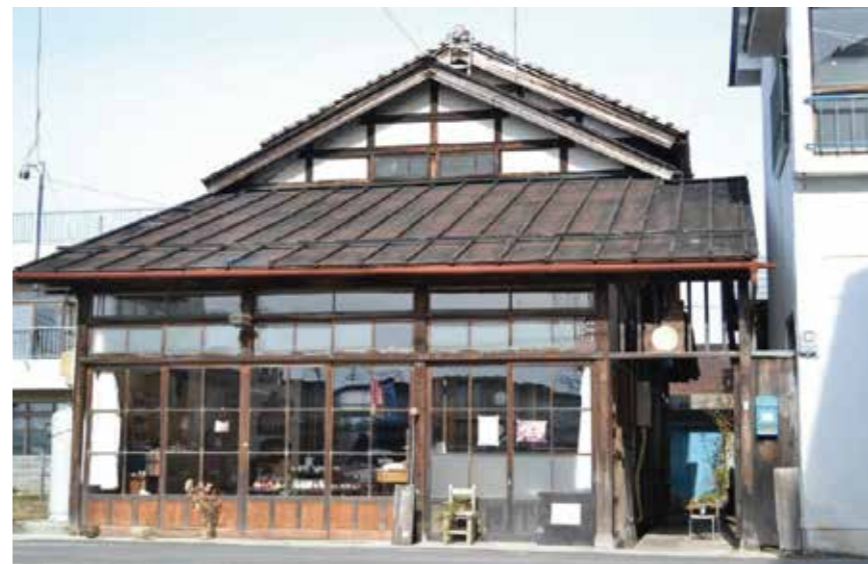
活動拠点「食堂つきとおひさま」 住所：福島県喜多方市寺町南5006 TEL:0241-23-5188

かったり、他にない特別なものだったり、そういうことが実際に活動を通して発見されてきています。例えば、森のはこ舟と関わることで、森に対する見方が変わったり、森との接し方が変わったり、そうした人が一人でも増えていくこと、それがまさに成果だと思います。そして、アートを通じた体験を、特に子ども達に経験して欲しいと思っています。全国的に学校のなかで美術の時間が減らされている中、こういったアートプロジェクトは地方でアートやアーティストと関わることでできるとも貴重な場とも言えます。アートプロジェクトを通して人が育って土壌を作っていくというイメージでしょうか。町である喜多方には、そんなことも求められていると思います。成果を数値化することは難しいけれど、森の見方やアートに対する考え方がじわじわと変化していくようなプロジェクトが仕掛けられたいですね」