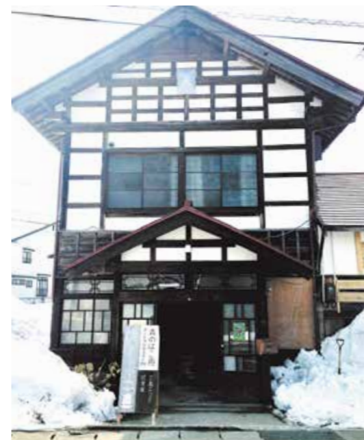
活動拠点「ゲストハウス ソコカシコ」 住所：福島県大沼郡三島町桑原荒屋敷1302 TEL:090-3345-3043

1979年、長野県生まれ。 長野県立諏訪清陵高校卒、武蔵野美術大学造形表現学部映像学科卒。大学卒業後20代は絵画、映像、パフォーマンスを中心にアート活動を展開。国内外でパフォーマンスアートフェスティバルに多数参加。アート活動の傍ら2年ほど国内外を放浪。その後飛騨高山にある「森林たくみ塾」にて2年間の木工修行を経て、三島町生活工芸館の木工指導員として勤務。現在同三島町にあるNPOわくわく奥会津.COMに勤務しながら、復興アートプロジェクト「森のはこ舟アートプロジェクト」に三島町エリアコーディネーターとして参加。