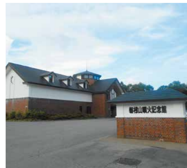
活動拠点「磐梯山噴火記念館」 福島県耶麻郡北塩原村大字松原字剣ヶ峯1093-36 TEL:0241-32-2888

1969年、東京都生まれ。東北大学文学部史学科卒(専攻は考古学)大学卒業後はUターンして都内出版社に勤務。主に宣伝部に所属し、新聞広告や中吊り広告などの出版広告全般のディレクションに携わる。2011年退職。以降は田舎暮らし・東北回帰への願望を日々募らせる。県中通りでの林業就業者講習(2012)など幾多の個人的トライアルを経て、2015年6月より北塩原村地域おこし協力隊員(北塩原村役場・総務企画課企画室所属)として会津に移住を果たす。