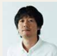
1973年生まれ。南相馬市博物館学芸員。相馬地方の伝統行事『相馬野馬追』を中心とした地域の歴史を研究し、国内外で野馬追の普及啓蒙活動を行う。震災・原発事故後は、県内のアートプロジェクトにも参画し、おもに南相馬市内でのアーティスト活動のサポートに携わっている。