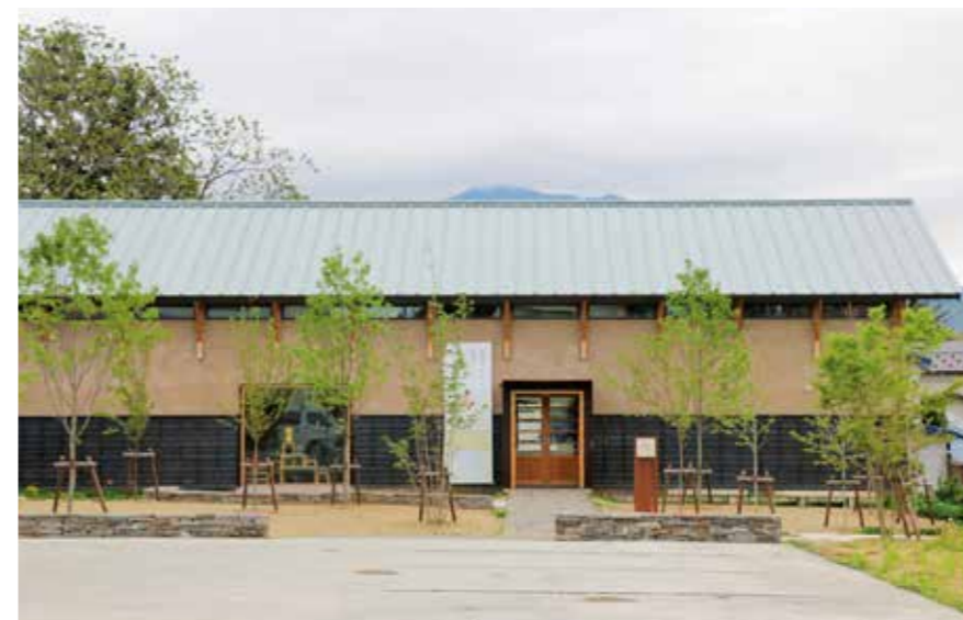
活動拠点「はじまりの美術館」 住所：福島県耶麻郡猪苗代町新町4873 TEL:0242-62-3454